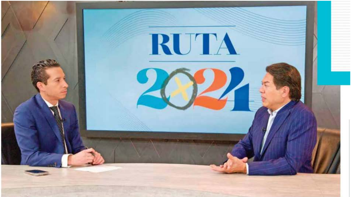
MANDATO • Delgado aseguró en Heraldo TV que el mensaje del 2 de junio es que Sheinbaum tenga el constituyente para aprobar las reformas.