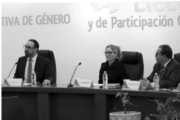
· Se evidenció que se operó desde varios puntos para un fraude electoral