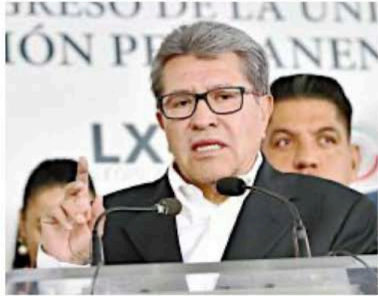
■ Ricardo Monreal, senador de Morena, dio por hecho que la reforma al Poder Judicial será aprobada.