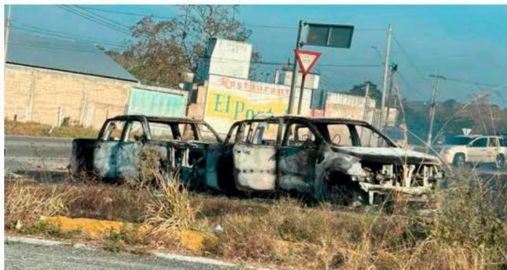
En Chicomuselo, Chiapas, la Fiscalía local confirmó el asesinato de 11 personas.

ACÉFALO. Otro ejemplo contundente es el de Chicomuselo, Chiapas, donde el 10 de mayo de 2024 un choque entre grupos delincuenciales dejó un saldo de 11 civiles muertos. La masacre derivó en semanas de caos, previo al 2 de junio. Fue tal el nivel de tensión y de revuelta entre la población que las autoridades electorales suspendieron la instalación de todas las casillas. En 2021 había llegado al poder el PT, pero hoy la alcaldía quedó acéfala, en la incertidumbre política y administrativa. Las atrocidades han tenido consecuencias...●