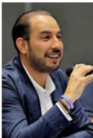
■ Marko Cortés, dirigente del PAN.