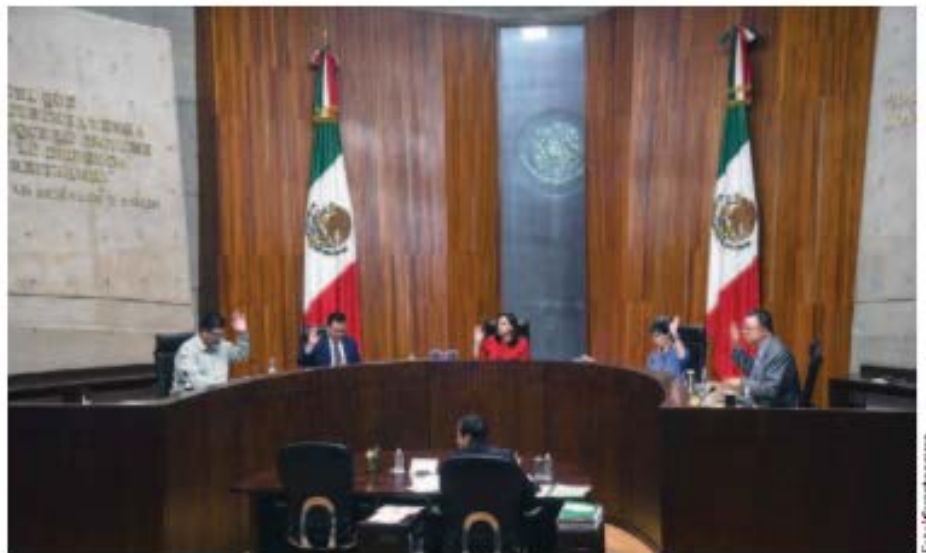
MAGISTRADOS del TEPJF en sesión del pleno, ayer.

EL TRIBUNAL Electoral indica que se espera tener 280 recursos de inconformidad contra los cómputos distritales de la presidencial; prevén validez de votos antes del 6 de septiembre