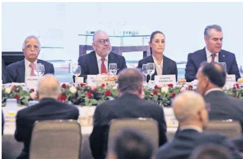
En la reunión con la virtual presidenta, los empresarios anunciaron inversiones por más de 42 mil millones de dólares.

“Hay muchas inversiones por encima de los 42 mil millones de dólares”, dijo, lo que incluye inversión extranjera directa y proyectos de capital nacional. ●